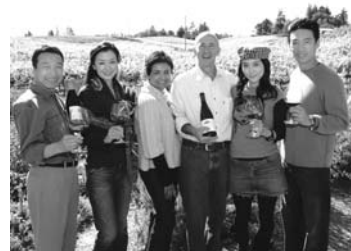
「サイドウェイズ」に登場するリンマーの畑の前で、フリッツ夫妻を囲む、映画主役4人。