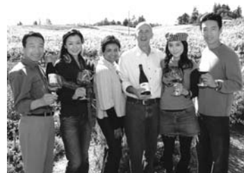
「サイドウェイズ」に登場するリンマーの畑の前で、フリッツ夫妻を囲む、映画主役4人。